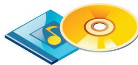
Hörsendungen / CD