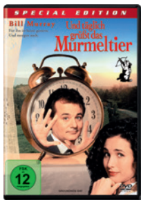
Film / DVD